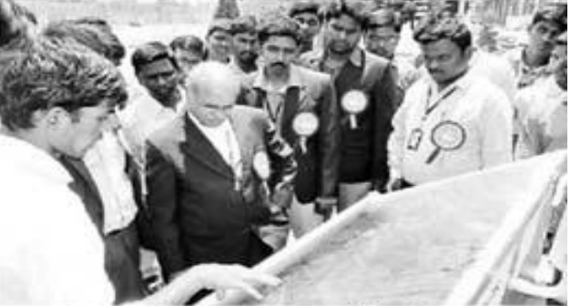
మెకానికల్ విద్యార్థులు తయారు చేసిన నీటిశుద్ధి పలికరాన్ని గులించి తెలుసుకుంటున, జేఎన్ట్రీయూ వీసీ లాలోకిషాకర్